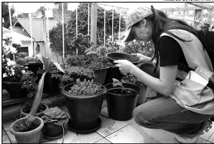
Ricardo Stricher / PMPA

Ações - A partir da ocorrência dos casos autóctones, foram intensificadas ações de controle larvário nesses bairros, incentivando a população para a remoção de criadouros e controle mecânico dos mesmos. Também foram realizadas ações de bloqueio nos bairros com transmissão do vírus, a fim de conter novos casos. Tal ação mostrou-se eficaz no controle do vetor, garantindo que os casos ficassem restritos a esses bairros.