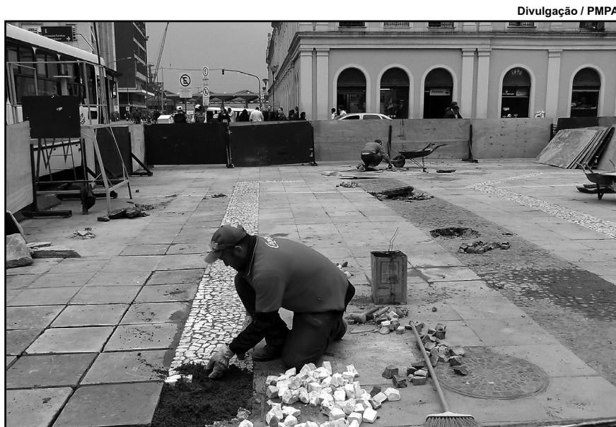
Largo Glênio Peres já está recebendo melhorias

Propostas - Foram ouvidos relatos de exemplos bem sucedidos de urbanistas do Brasil e exterior, além de opiniões de moradores, comerciantes, frequentadores e pessoas que trabalham no Centro Histórico, especialistas em trânsito, transporte e segurança. A partir desses dados, foram sugeridas propostas para tornar a área um local atrativo e agradável: melhorar a qualidade paisagística e ambiental, criar um sistema integrado de segurança, fortalecer polos de comércio e serviços diferenciados e exclusivos.