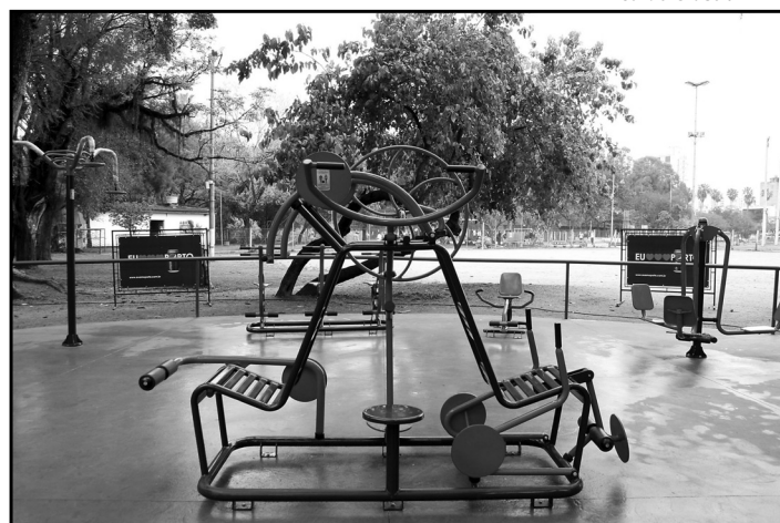
Ricardo Giusti / PMPA

estacionamento para portadores de deficiência e motociclistas. Foram substituídas 78 luminárias, recuperado o piso junto ao chafariz, instalados 20 bancos, 30 novas lixeiras na João Pessoa, além de outras 16 na Osvaldo Aranha.