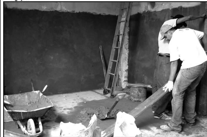
Casas bombeiam as águas da chuva

Casa 5 - Situada na BR 290, após a ponte sobre o Guaíba, é responsável por drenar as águas do bairro Humaitá e parte das águas do bairro Navegantes. Será instalado um novo conjunto motor-bomba com vazão de 2,5 mil litros por segundo de bomba submersa, que ampliará a capacidade de vazão da casa, de 7,75 mil litros por segundo, para 10,25 mil litros por segundo. Ainda será instalado um grupo gerador para abastecer duas bombas.