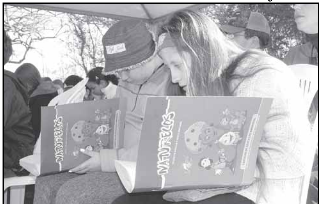
Cartilha concorreu com outros 164 projetos