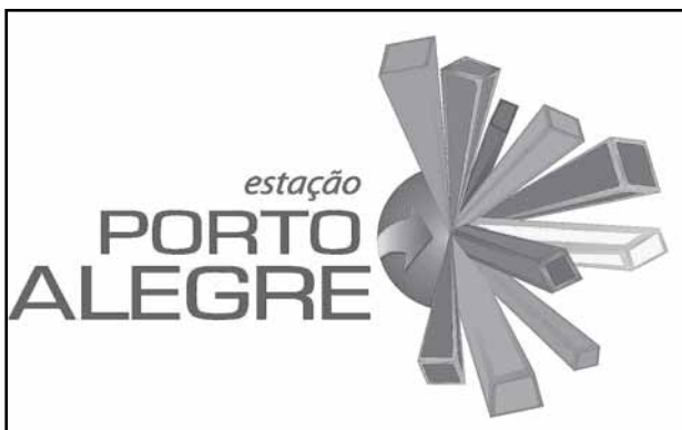
Programa com foco em turistas do interior será apresentado no encontro

Organizado pela Ugart-RS, o Salão contará com mais de 30 expositores de diferentes regiões brasileiras que apresentarão pacotes, novidades e atra-