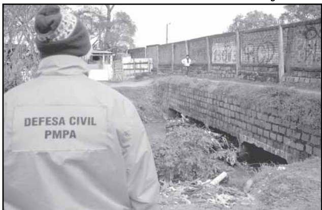
As zonas mais atingidas pelas chuvas foram a Leste e a Sul