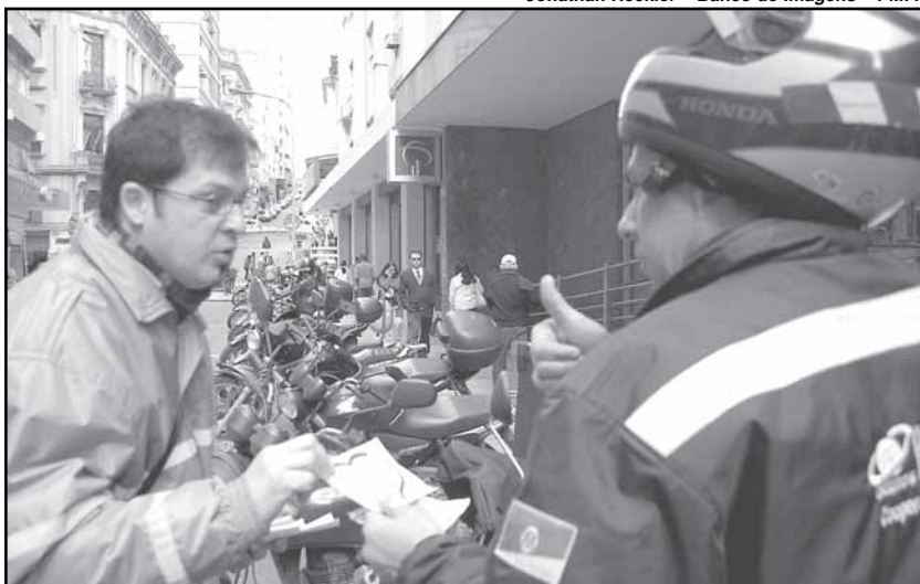
Agentes alertaram para o uso do capacete e respeito à velocidade