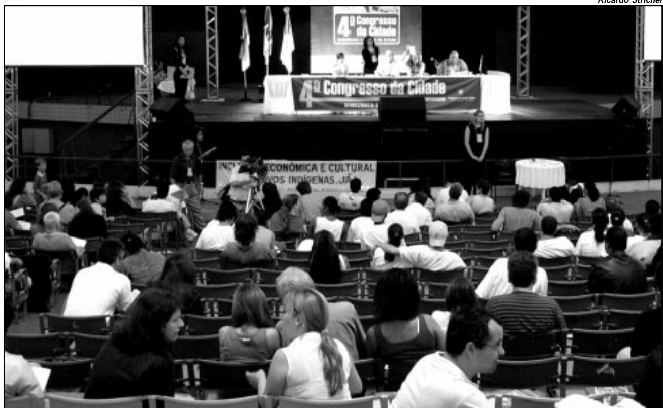
Foram aprovadas questões importantes como o reajuste do valor venal dos imóveis

Foram aprovadas propostas de proteção ao comércio lo-