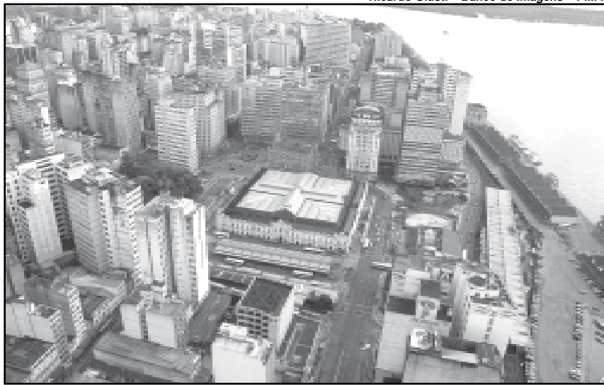
Objetivo do evento é apontar uma solução conjunta para a região

Viva o Centro — É um dos 21 programas estratégicos do novo Modelo de Gestão. Tem o objetivo de reabilitar o centro histórico, estimulando seu potencial econômico e resgatando sua atratividade, de forma a valorizar o patrimônio cultural e ambiental existente no bairro. O programa conta com a participação de praticamente todas as secretarias e departamentos, incluindo parcerias com outras esferas de governo e a iniciativa privada.