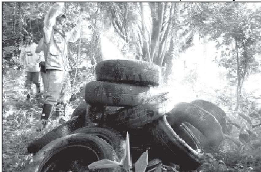
Pneus abandonados acabam virando focos de proliferação do mosquito causador da dengue

Benefícios para a cidade — A parceria permite que a Anip atenda à norma prevista na Resolução 258, de 26 de junho de 1999, a qual estabelece que, para cada quatro pneus novos fabricados no país ou pneus novos importados, inclusive aqueles que acompanham os veículos importados, as empresas fabricantes e as importadoras deverão dar destinação final a cinco pneus inservíveis. Para que o acordo entre o DMLU e a Anip continue o bom desempenho, é preciso que a comunidade porto-alegrense colabore, entregando os pneus nas unidades do DMLU.