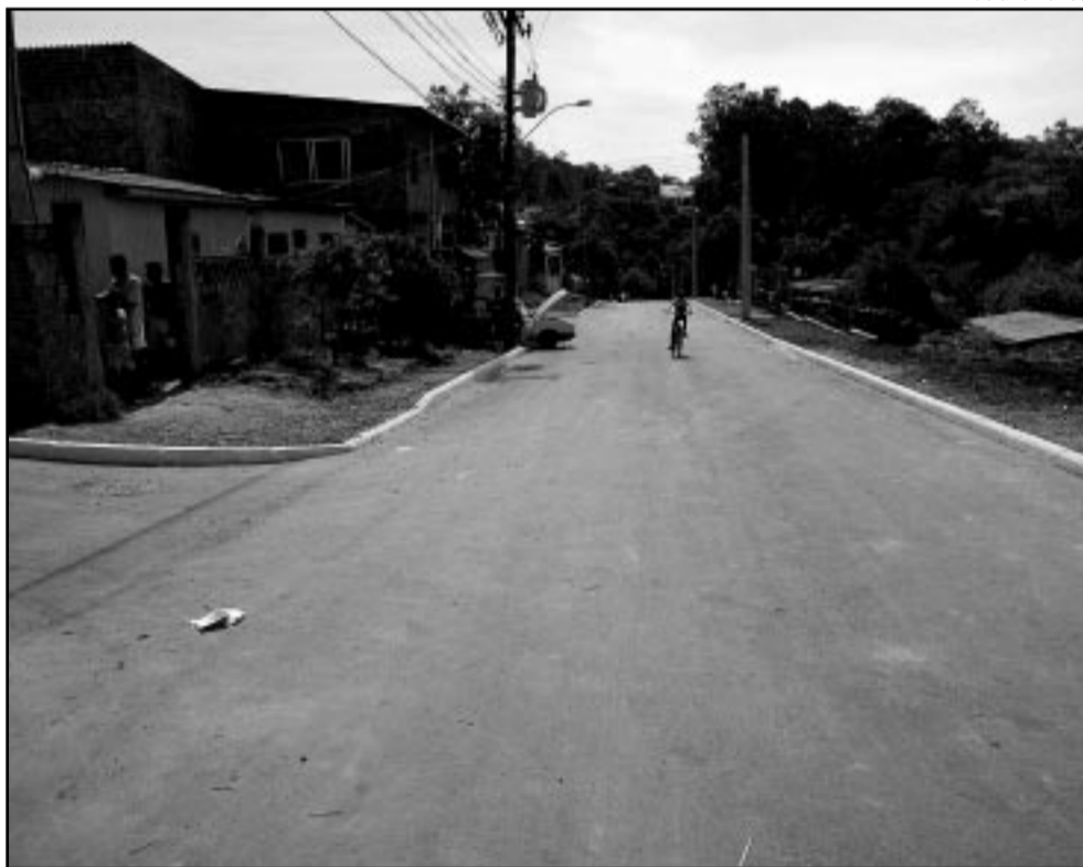
Além do piso de asfalto, será implantado sistema de drenagem nas vias