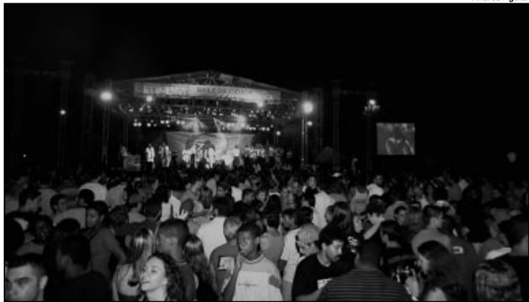
Tradicional baile no Parque Farroupilha, com a banda Elenco, é uma das atrações