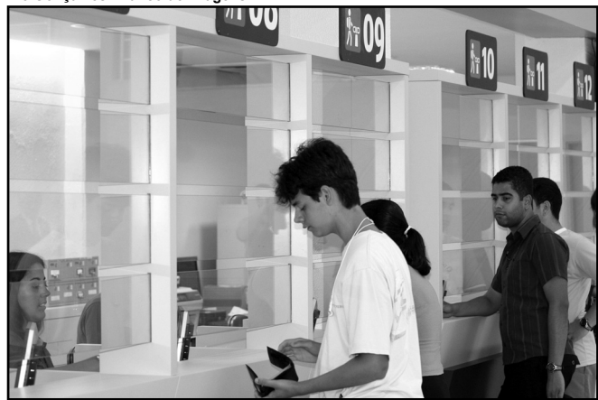
Estudantes deverão utilizar o Centro de Passagem da Uruguai ou o posto 2

A partir de segunda-feira, 3 de janeiro, as recargas de créditos escolares não poderão ser realizadas nos postos 3, Zona Sul, e 4, Zona Leste, em razão das férias escolares. Esses postos reabrirão em 3 de fevereiro, para atendimento dos portadores do cartão TRI Escolar.