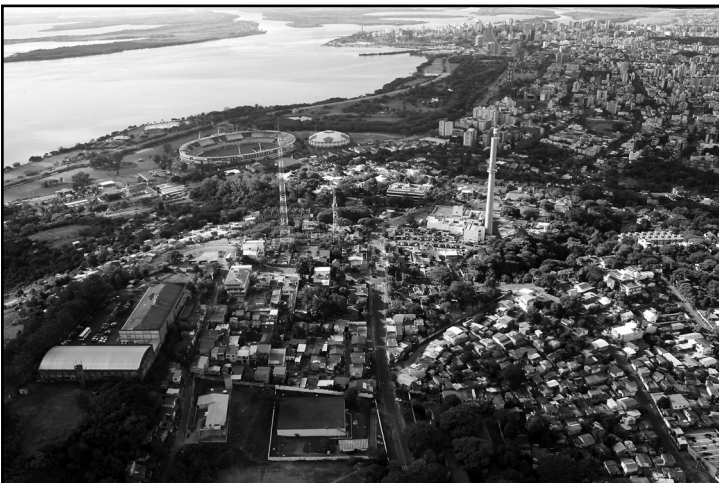
Pagamento deve ser feito até o dia 3 de janeiro de 2011

Os porto-alegrenses poderão aproveitar o desconto de 20% no pagamento em cota única do Imposto sobre a Propriedade Predial e Territorial Urbana (IPTU) e da Taxa de Coleta de Lixo (TCL) de 2011. A Secretaria Municipal da Fazenda (SMF) distribuiu as guias pelo correio e disponibiliza acesso ao documento no site www.portoalegre.rs.gov.br/iptu/GUIANOVA , mediante informação da inscrição do imóvel. O pagamento deve ser feito até 3 de janeiro de 2011, na rede bancária conveniada com a prefeitura.