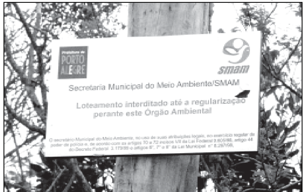
Vender terrenos em loteamentos irregulares ou clandestinos é crime