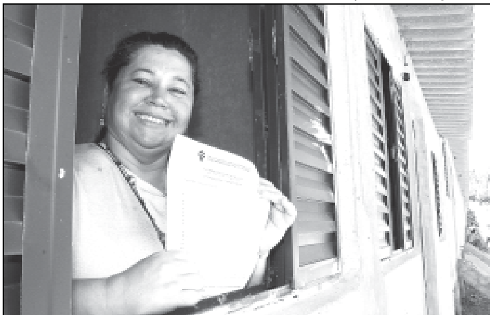
Programa de Regularização Fundiária beneficiou moradores de vários bairros