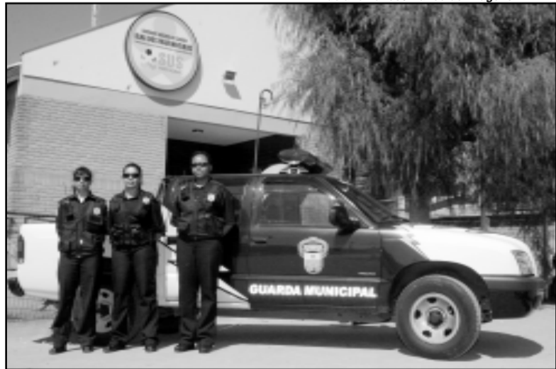
Dados servirão para o planejamento operacional da Guarda Municipal