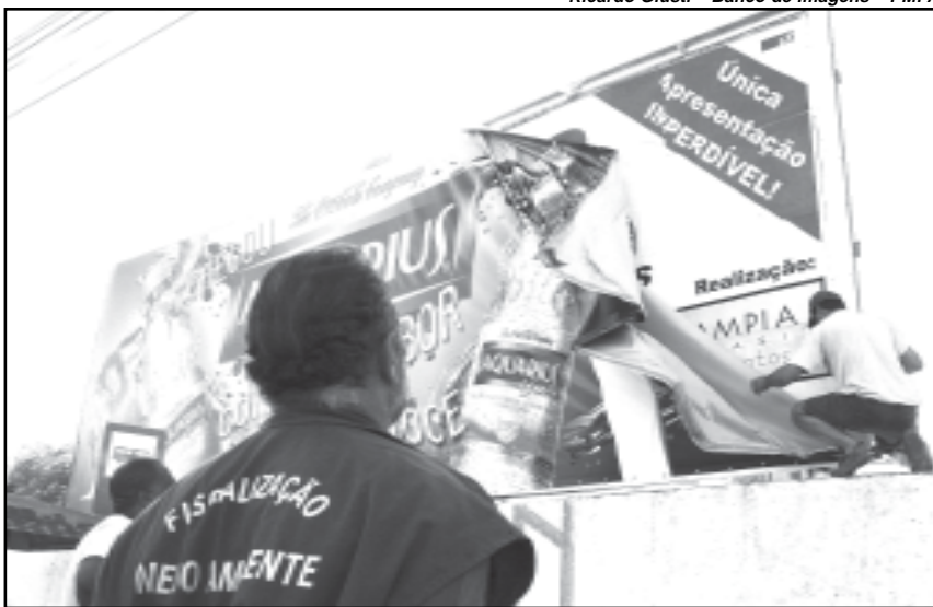
Em média, são retiradas das ruas mais de 300 propagandas irregulares por semana

Adequação da Lei — Antes, a equipe de fiscalização autuava os empreendimentos cumprindo exigência de Lei Municipal nº 8279/99, que estabelecia um valor de