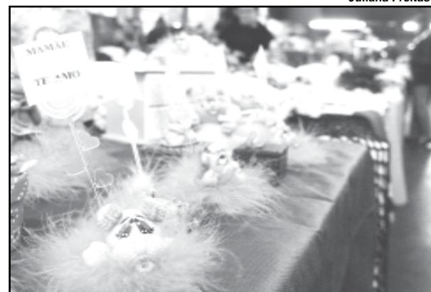
Estandes oferecerão presentes