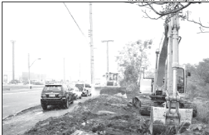
Avenida deve estar duplicada em setembro

Imobiliários executará a obra como contrapartida em função da construção de um novo shopping na Zona Sul da Capital. A via deve estar pronta em setembro, mês em que o empreendimento será inaugurado. O investimento é de R$ 11,5 milhões. “É uma obra que vai mudar o perfil da cidade e da região com um impacto extraordinário para o desenvolvimento da Região Sul, a expansão da economia e a melhoria da qualidade de habitação e da qualidade de vida”, disse o prefeito.