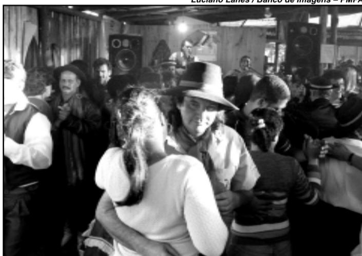
Acampamento termina no próximo dia 20

Iniciativa da Associação Brasileira de Intercâmbio Cultural (Abic), o programa de intercâmbio traz jovens de todo o mundo para exercerem atividades voluntárias em entidades sociais brasileiras e aprender a falar a língua portuguesa. Apesar de terem dificuldade de entender o que os brasileiros dizem, eles, surpreendentemente já articulam palavras em português com alguma fluência, mesmo estando somente há três semanas no Brasil.