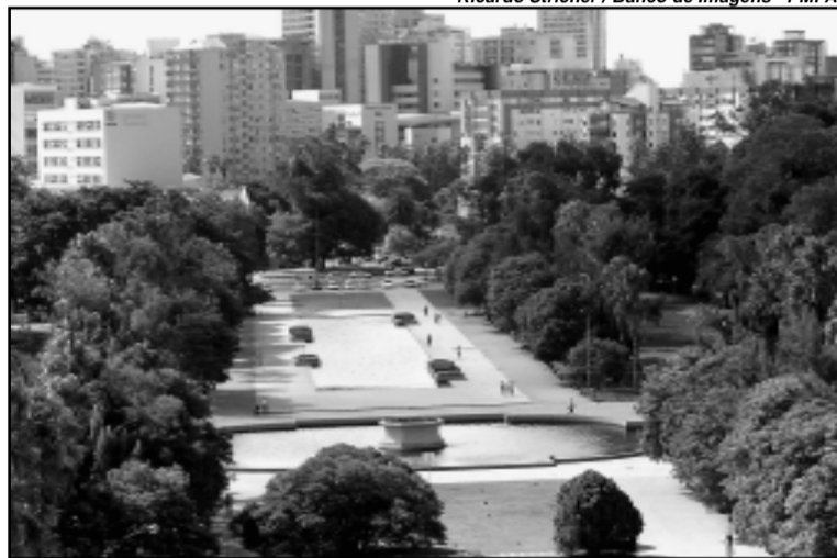
Em 1935, por decreto municipal, a área recebeu a denominação de Parque Farroupilha