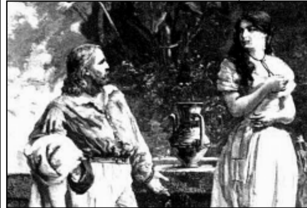
Garibaldi e Anita em exposição