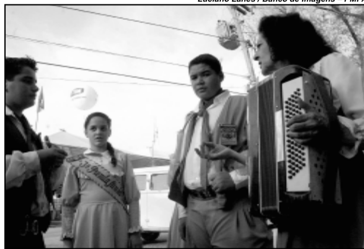
Alguns piquetes têm festa e baile todos os dias

Um grupo de 16 jovens ingleses, alemães, belgas, islandeses, italianos, suecos e austríacos, participantes de um programa de intercâmbio na capital gaúcha, percorreram du-