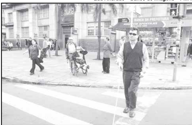
Porto Alegre aderiu ao compromisso nacional de trabalhar na eliminação de barreiras físicas, de comunicação e de atitudes

Os cinco alunos terão aulas todas as terças e quartas-feiras, das 13h às 17h, numa iniciativa da prefeitura, em parceria da Secretaria Especial de Acessibilidade e Inclusão Social (Seacis) e Procempa. Os encontros ocorrerão no Centro