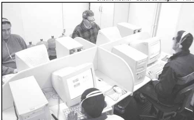
Aulas serão às terças e quartas-feiras, até dezembro