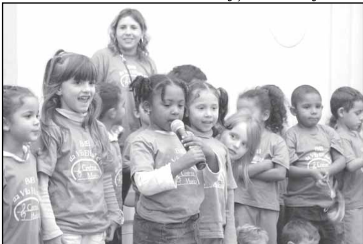
Conforme a proposta, a educação deve receber 25% dos recursos

operações receberão contrapartida da prefeitura no valor de R$ 38 milhões.