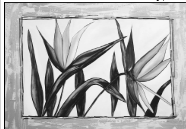
Telas mostram cores fortes