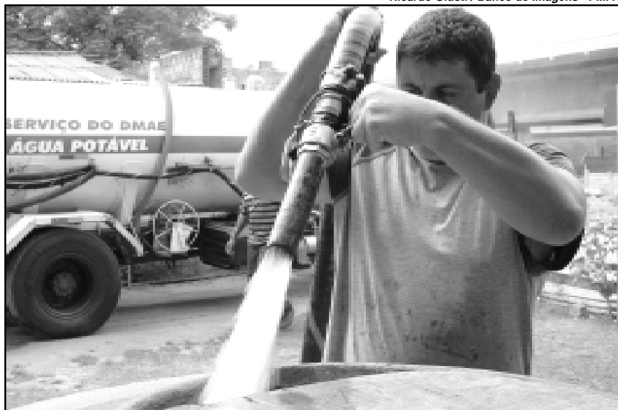
Meta é reduzir em 10% o consumo de água nos órgãos municipais