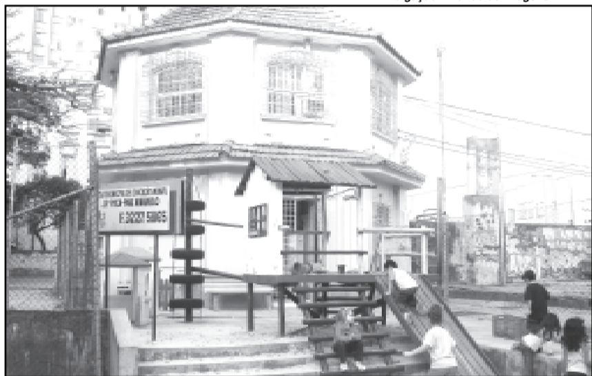
A escola foi fundada em 1926 pelo intendente Otávio Rocha