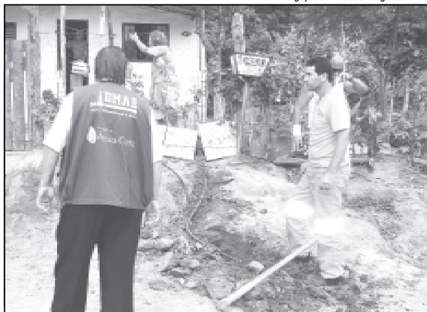
O Água Certa foi criado em maio de 2005 com o objetivo de regularizar as ligações de água