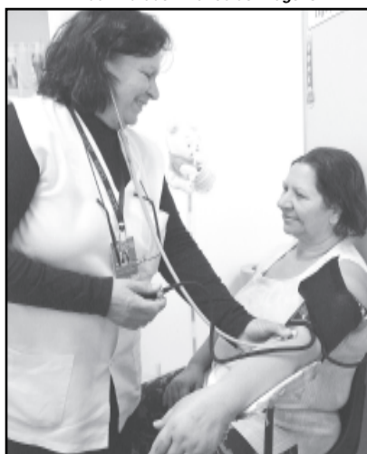
A comunidade atendida pelo PSF e os profissionais aprovaram as reformas realizadas na unidade