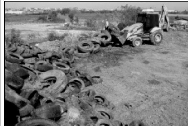
Para cada quatro pneus colocados no mercado, os fabricantes precisam dar um destino correto (de acordo com as normas ambientais) a cinco carcaças