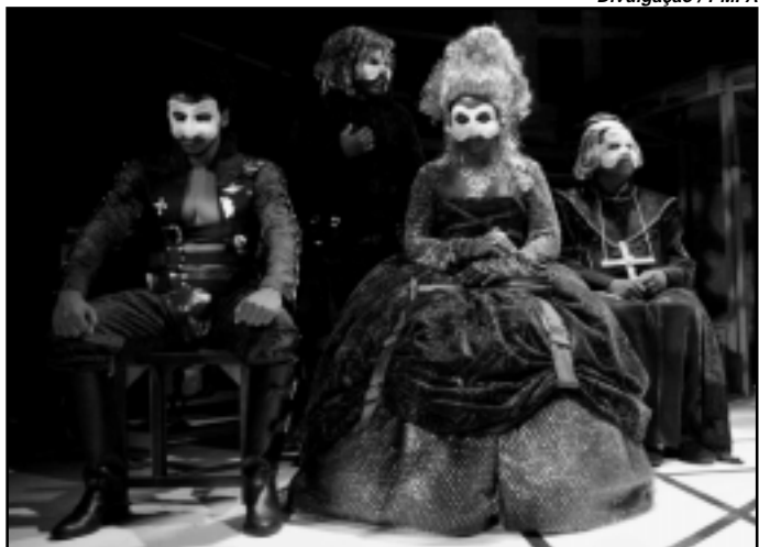
Os negros , de Luiz Antônio Pilar, estreia hoje, no palco do Theatro São Pedro