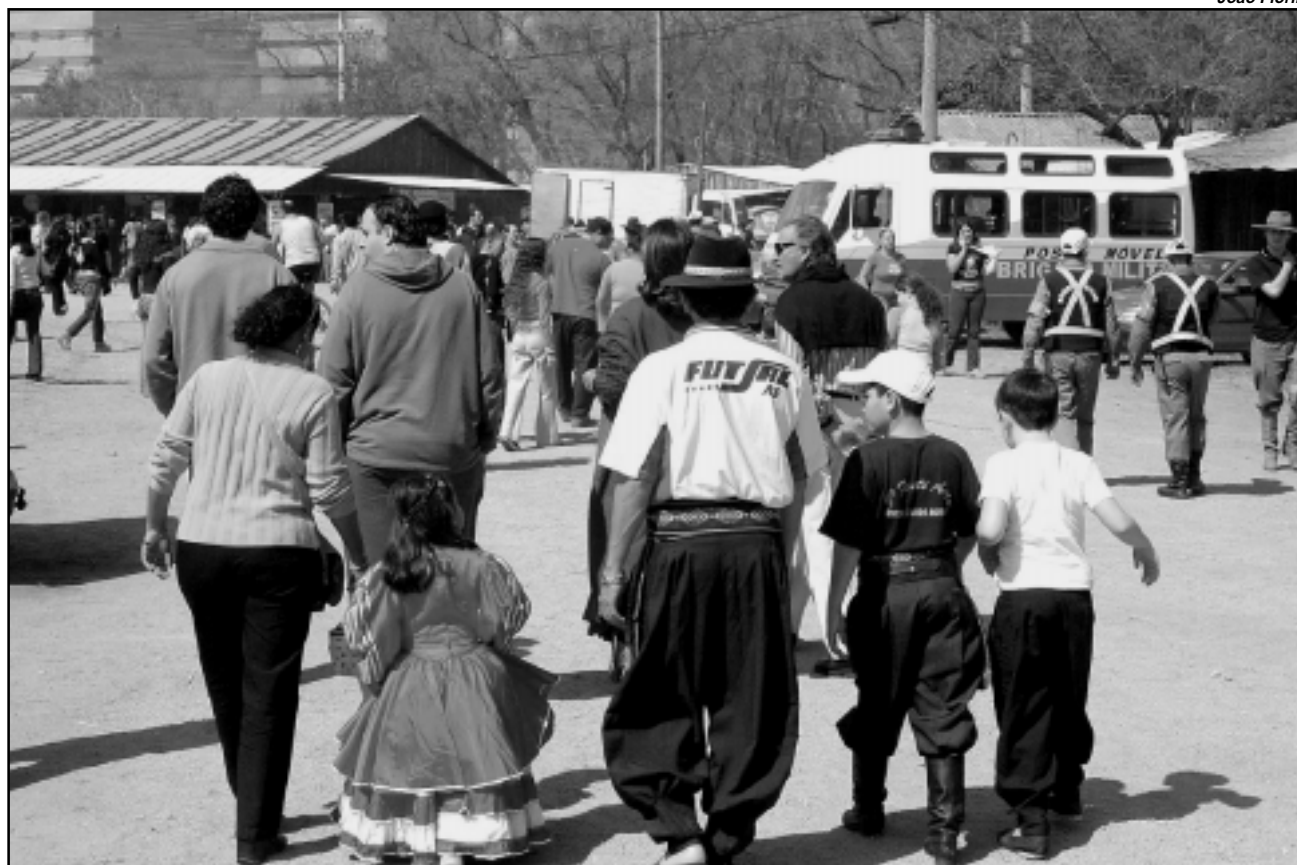
É esperado um público de mais de 600 mil pessoas até 20 de setembro