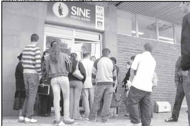
O posto do Sine Porto Alegre fica na avenida Mauá, 1013