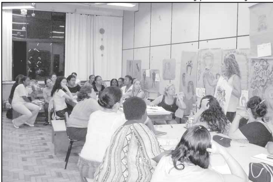
A primeira etapa do programa iniciou em agosto, contou com 360 horas/aula e capacitou 103 educadores