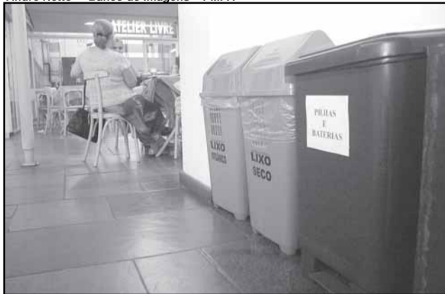
Apenas 1% da quantidade de pilha consumida é processada e tem um destino ambientalmente correto

O Centro Municipal de Cultura, Arte e Lazer Lupicínio Rodrigues, na av. Érico Veríssimo 307, colocou à disposição do público, no saguão, recipiente para coleta de pilhas e baterias usadas. A medida da Secretaria Municipal de Cultura (SMC) vai ao encontro da política de prefeitura de proteção ao meio ambiente. Aproveita também o aumento do público frequentador previsto para o local, onde dois teatros, Renascença e a Sala Álvaro Moreyra, serão palcos de espetáculos do 16º Porto Alegre em Cena, de 8 a 25 de setembro. No CMC, há ainda o Atelier Livre e a Biblioteca Pública Municipal Josué Guimarães.