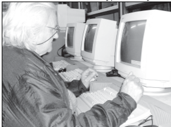
Já foram atendidos 390 alunos com mais de 60 anos

As aulas são ministradas em seis semanas, incluem conteúdos de Introdução à Informática, Pacote Office, Sistema Operacional e Internet e, na Usina do Gasômetro acontecem de terça-feira a domingo, das 9h às 21h. Na Restinga, ocorrem de segunda a sábado, das 8h às 22h. O atendimento no Santander Cultural é de segunda a sexta-feira, das 10h às 17h45.