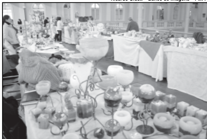
Os produtos são comercializados nas feiras temáticas e de economia solidária

Prevista para vigorar dois anos, podendo ser renovada, a parceria beneficia comunidade do Bairro Sarandi, onde funciona a Incubadora. Inaugurado em 1999, o projeto conta com dois grupos de mulheres que produzem artigos com papel artesanal e trabalham na área de corte e costura, com a produção de peças de vestuário e artesanato. Os produtos são comercializados nas feiras temáticas e de economia solidária promovidas pela Smic, além de eventos da prefeitura.