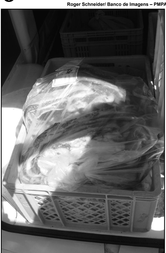
No supermercado, os cuidados devem ser dobrados

Preparação – O preparo dos alimentos é outro item que merece atenção. A dica é organizar para serem servidos em horário próximo ao da refeição, não ultrapassando o tempo de 2h em temperatura ambiente.