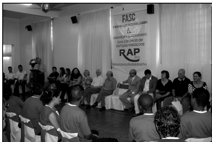
Fundação está contratando 40 novos educadores sociais

Começar de Novo, o jovem foi selecionado para ser um dos educadores que atuarão na Região Leste da Capital.