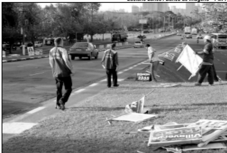
Luciano Lanes / Banco de Imagens - PMPA

Hoje, às 17h30, mais dez caminhões sairão do estacionamento do Parque Marinha do Brasil, em frente ao TRE, cada um com dois garis e um fiscal do TRE, além de escolta da Brigada Militar, para varrer da cidade a propaganda deteriorada ou mal colocada. No domingo, dia da eleição, a operação será de limpeza geral.