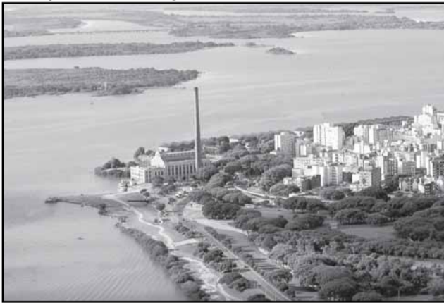
Imagem aérea da orla do Guaíba

A Secretaria Municipal de Obras e Viação (Smov) publicou nesta quarta-feira, dois editais para a contratação de obras de reurbanização na orla do Guaíba. Um deles prevê a recuperação de área localizada no entorno da Usina do Gasômetro; o outro dispõe sobre a construção de um trapiche no bairro Ipanema, em frente à rua Otelo Rosa. “Esta ação da prefeitura vai preparar a cidade para o futuro e para receber a Copa 2014, valorizando o turismo e qualificando a orla”, afirmou o titular da Smov.