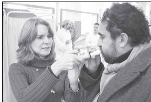
Objetivo é fazer com que os servidores se sensibilizem para abandonar o hábito de fumar