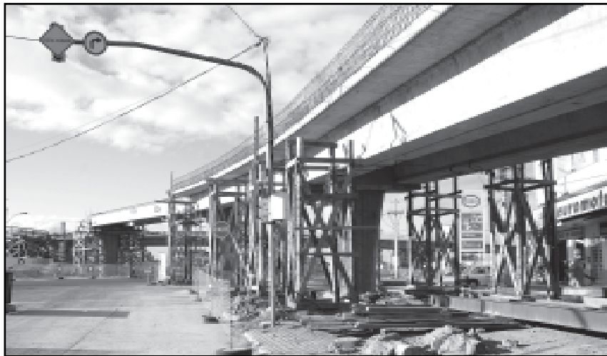
O custo da construção do viaduto Leonel Brizola é de R$ 9,3 milhões

Obras complementares — De acordo com o engenheiro responsável, 80% das obras do viaduto estão prontas. Até o final de maio, será concluído o último pilar. Além disso, equipes trabalham na concretagem dos guarda-corpos (mureta do viaduto que serve de proteção) e na colocação das lajes.