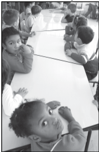
A construção da creche Maria Bastos foi uma demanda definida pela comunidade em 2002