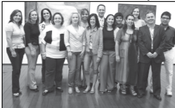
Gerentes e líderes de ação viajam a Washington, dentro do Programa de Capacitação

O Sistema de Capacitação e Reconhecimento da prefeitura teve 131 inscritos e constou de duas etapas. Na primeira, os servidores participaram de curso de capacitação em gestão sistêmica. A segunda foi a avaliação do desempenho dos participantes no gerenciamento dos programas ou das ações. A pontuação final resultou da soma das notas obtidas nas duas fases, de acordo com a proporcionalidade prevista no regulamento. O processo foi acompanhado por uma comissão de transparência, integrada por representantes da Federasul, Programa Gaúcho de Qualidade e Produtividade, Escola Superior de Propaganda e Marketing e Project Management Institute .