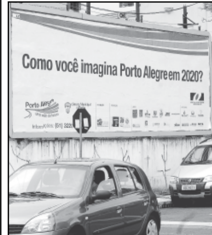
Painéis nas ruas alertam para a preocupação com o futuro de POA