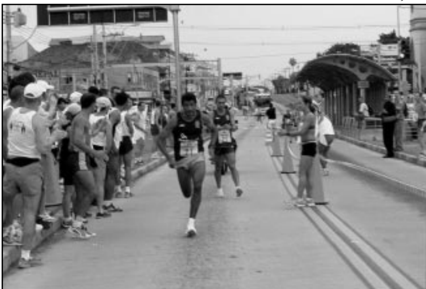
Atletas perfazem trajeto de 21 quilômetros na pista da 3.ª Perimetral