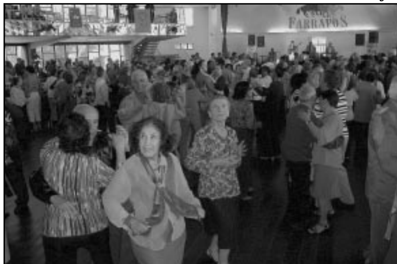
Cerca de 800 pessoas se divertiram durante a tarde no Clube Farrapos