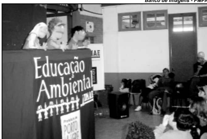
Dmae participa com a Equipe de Educação Ambiental

O passeio orientado começa às 9h, com a saída da Estação Moinhos de Vento para a Estação de Bombeamento Voluntários da