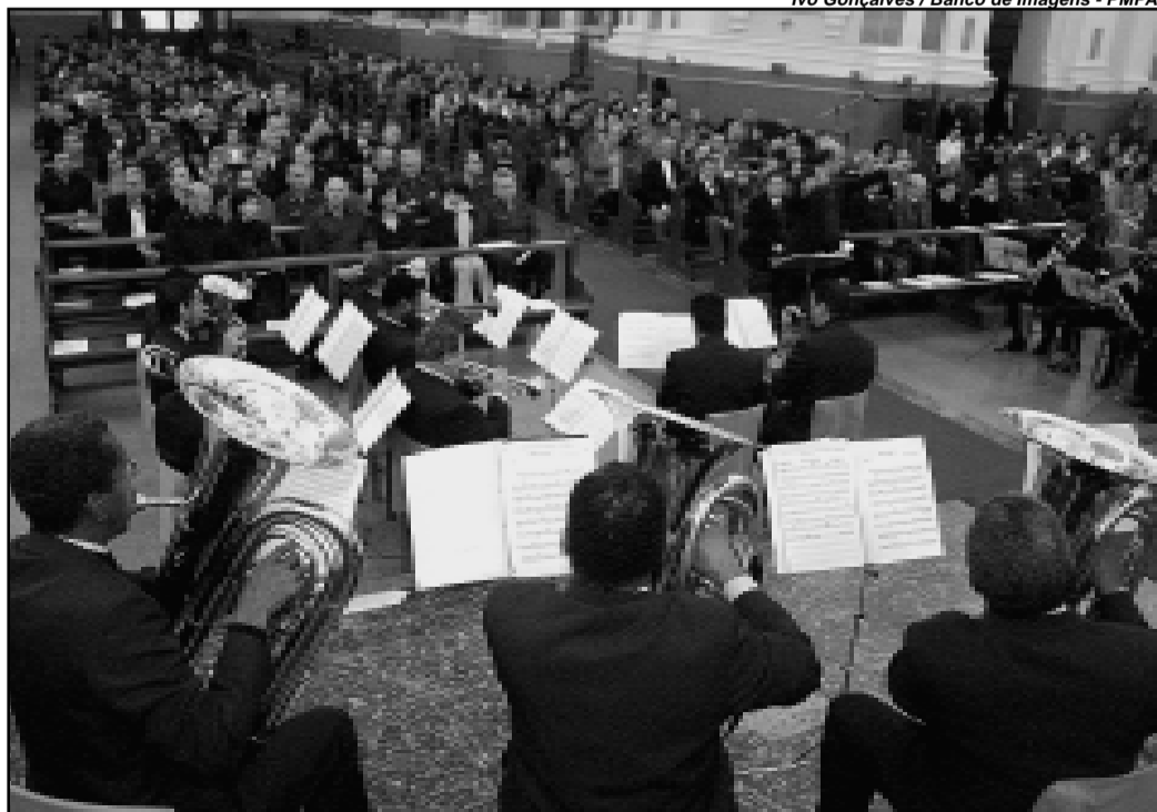
Projeto reúne a Banda Municipal com músicos populares e eruditos