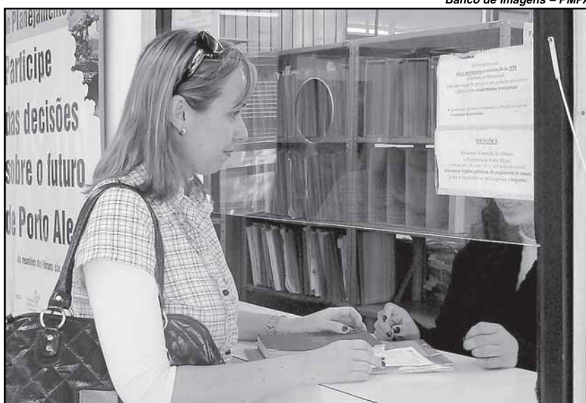
Banco de Imagens – PMPA

De janeiro a junho deste ano, o Plantão do Plano Diretor atendeu 799 pessoas, a maioria arquitetos, engenheiros, proprietários de imóveis e pessoas interessadas em negócios. O secretário do Planejamento alerta para a necessidade de consultar o setor: Os funcionários da secretaria fornecem informações importantes para quem vai comprar, alugar um imóvel ou instalar uma empresa. “Antes de construir uma casa, é preciso ter certeza que as leis urbanísticas permitem executar o projeto, o mesmo vale para abrir um negócio, comprar um prédio ou terreno que podem estar em área irregular, de risco, não edificável.”