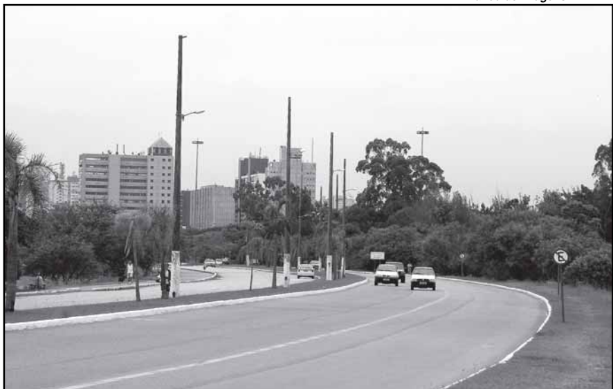
Primeiros trechos têm extensão de 1,38 quilômetro

Marco no conjunto de ações da prefeitura para a Copa 2014, a duplicação da avenida Beira-Rio é uma das primeiras obras específica para o evento esportivo a ser iniciada no País. A extensão total das obras é de 5,3 km quilômetros, com investimentos da ordem de R$ 24 milhões.