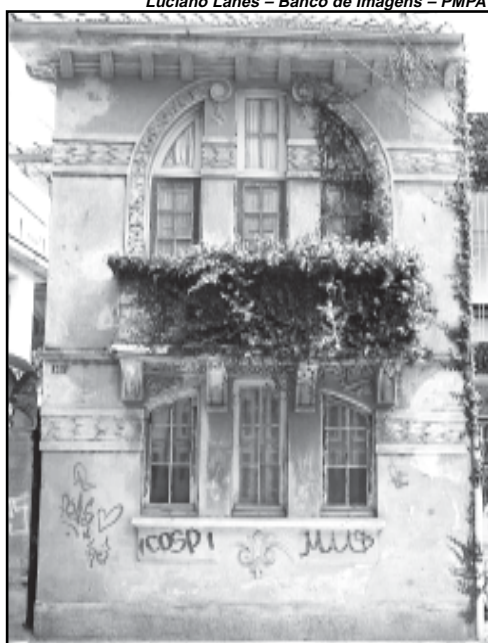
Prédio da Demétrio Ribeiro

unidades de habitação, pertencem a pessoas diferentes. O condomínio São Salvador, por exemplo, em frente ao Hotel Everest e ao lado das escadarias do Viaduto Otávio Rocha, conta com 78 condôminos. O financiamento destinado a esta edificação para a recuperação da fachada e telhados é de R$ 286,3 mil. Para o condomínio Santos Dumont, conhecido da maioria dos porto-alegrenses como Edifício Sulacap foram reservados recursos de R$ 192,5 mil.