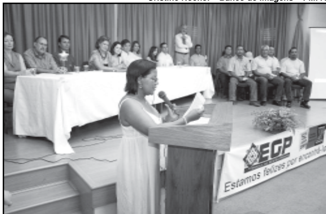
Escola de Gestão capacitou mais de 6,7 mil servidores este ano