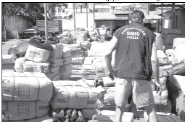
Os atos públicos de doações serão realizados no depósito da Smic, na Travessa do Carmo, 120