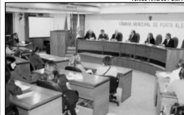
Fórum da Cosmam discutiu situação de carroças