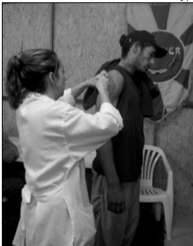
Moradores de rua estão sendo vacinados contra gripe, tétano e hepatite B