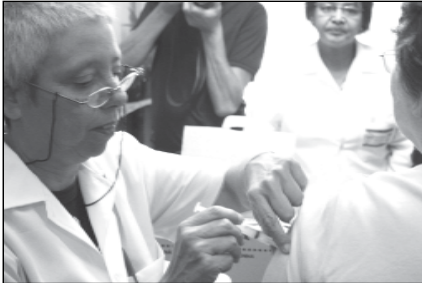
Campanha teve início em abril e terminou sexta-feira

A gripe é contagiosa, podendo apresentar-se de maneira leve e de curta