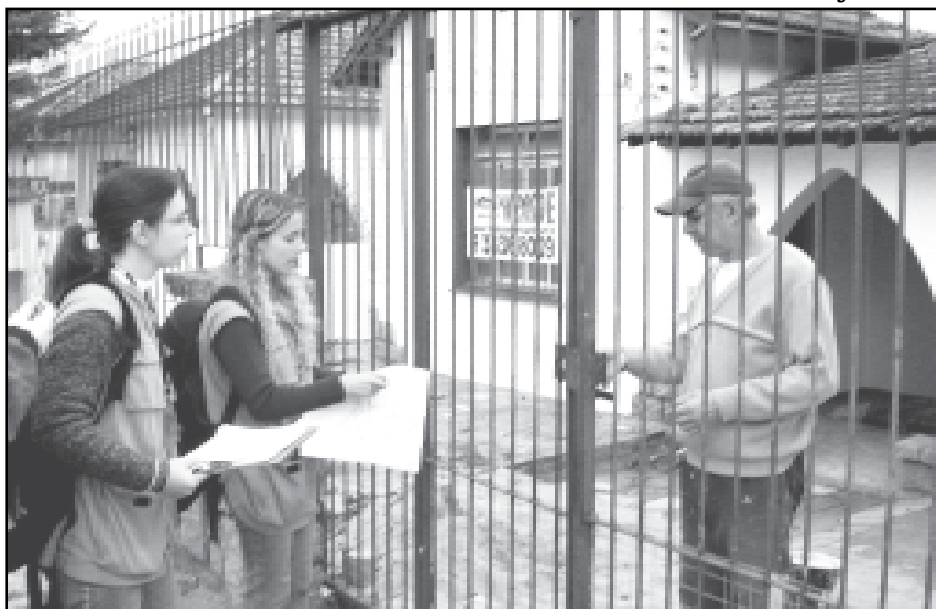
Trabalho encerra nesta sexta-feira

Método - Por meio de amostragem, conforme metodologia definida pelo Ministério da Saúde, serão identificadas as larvas e medido o Índice de Infestação Predial (IIP), que expressa, em percentual, o número de imóveis com a presença de larvas do Aedes aegypti em relação ao total de imóveis inspecionados. Os números serão avaliados e resultarão no diagnóstico que norteará medidas e ações de combate ao mosquito. O levantamento deve ser realizado no prazo de uma semana, sem a ocorrência de chuvas.