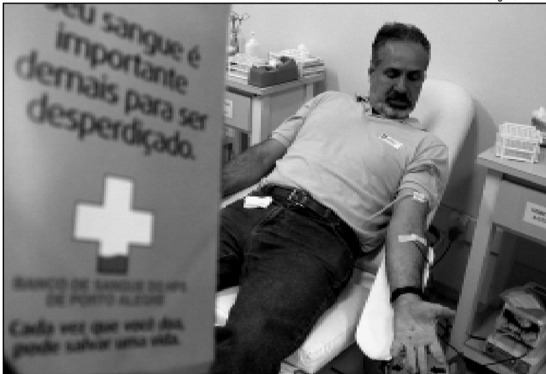
Banco de Sangue do HPS possui 12 mil cadastrados