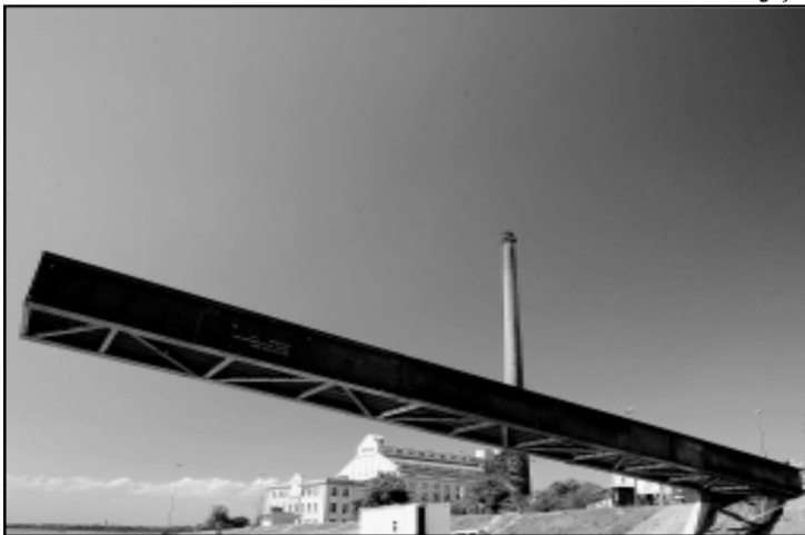
Olhos Atentos, obra de José Resende

A obra de Carmela Gross, Cascata, consiste em 16 degraus de concreto com 23 metros de largura e tem como intenção ligar a calçada com a beira do Guaíba, permitindo a interação da população. “Minha idéia não é fazer uma escultura no sentido tra-