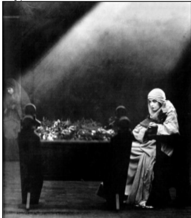
Intolerance foi produzido em 1916

A Sala P. F. Gastal (Usina do Gasômetro - 3º andar) coloca em cartaz a partir desta quarta-feira, às 15h30, uma mostra dedicada ao pioneiro do cinema americano, D. W. Griffith (1875-1948), reunindo quatro filmes representativos daquele que foi o principal responsável pelo estabelecimento da linguagem narrativa clássica no cinema. A mostra marca a passagem do 90º aniversário do título mais célebre de Griffith, Intolerância, realizado em 1916 e um dos filmes a serem exibidos no programa.