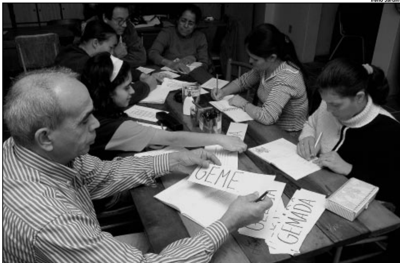
Programas de educação de adultos interessam instituição do Algarve