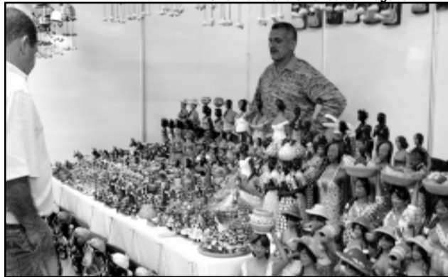
Feira tem mais de 90 estandes e a participação de 180 artesãos