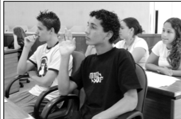
Alunos do Lami pedem infraestrutura