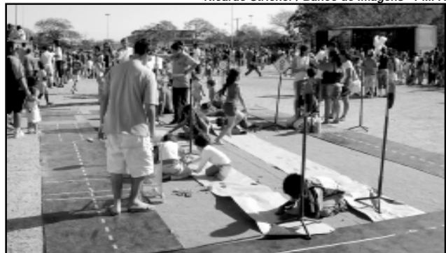
Evento terá atividades recreativas e de educação ambiental