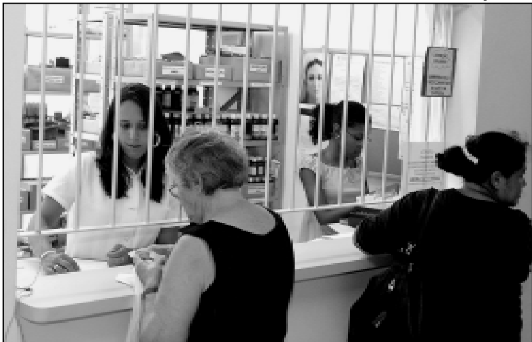
Farmácia, com novas instalações, obteve avaliação ótima ou boa