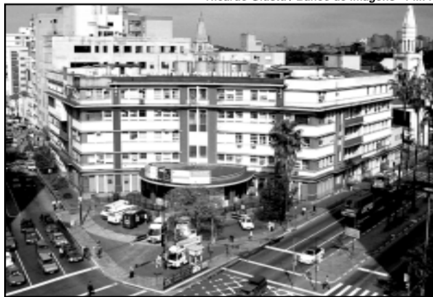
Previsão é de que as obras sejam concluídas em 11 meses