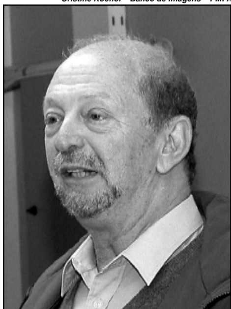
Moacyr Scliar é um dos autores do primeiro título a ser lançado pela Editora da Cidade

O livro — Ao longo das 125 páginas de Porto Alegre em Contos , escritores como Moacyr Scliar, Sérgio Faraco, Letícia Wierzchowski e Charles Kiefer percorrem em suas pequenas ficções espaços tradicionais da cidade como o Hotel Majestic, o Mercado Público, descobrem ruazinhas escondidas nas entranhas da cidade, elegem seus pombos como personagens. Seus protagonistas tomam Bomba Royal na Banca 40, ou cachaça no Bar Naval, cometem pecados no Bairro Navegantes, vêem as horas no relógio da Matriz, perambulam na volta do Gasômetro.