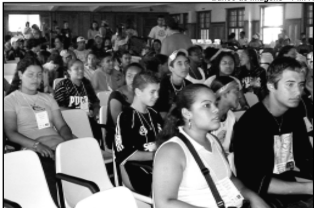
O encontro promoveu a troca de experiência entre os jovens, que participam do programa em diversas regiões da Capital

dação de Assistência Social e Cidadania (Fasc), reuniram-se no Colégio Marista Rosário no último fim de semana. Além de um balanço das atividades realizadas no decorrer do ano, o Encontro Municipal promoveu a troca de experiência entre os jovens, que participam do programa nas mais diversas regiões da Capital.