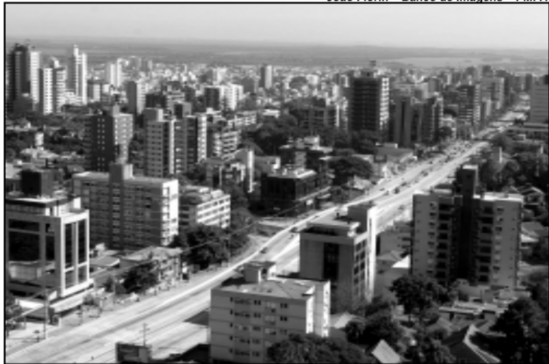
Porto Alegre é capital que oferece mais facilidades para o contribuinte pagar o seu imposto