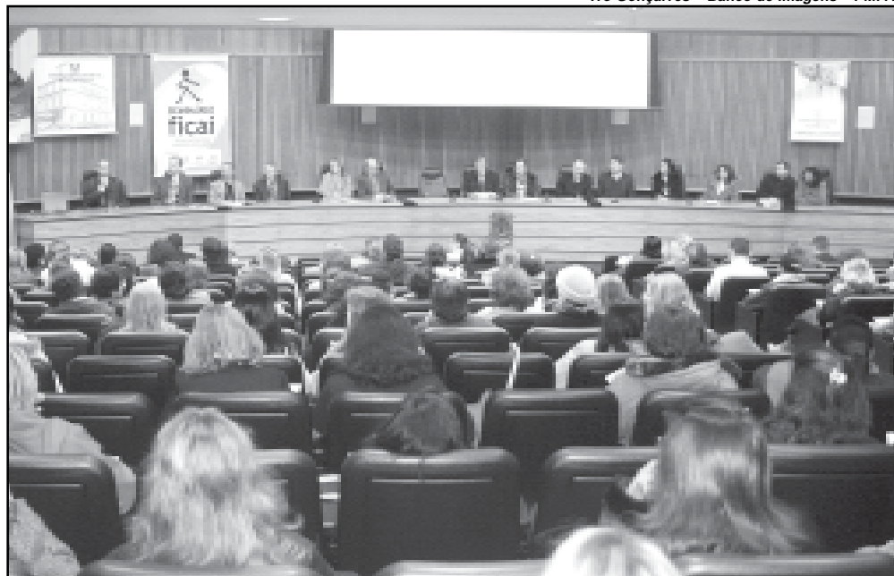
O mapeamento de 2006 nas 50 escolas de Ensino Fundamental apontou que 80% dos alunos retornaram à escola e permanecem estudando