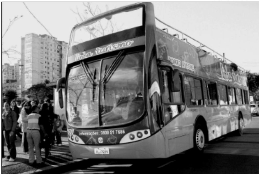
O Escritório Municipal de Turismo e a Carris prepararam um calendário de promoções especiais, que se inicia amanhã