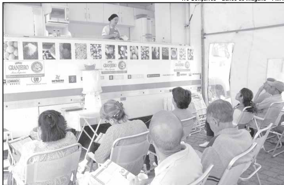
O curso promove a educação alimentar e ensina sobre o aproveitamento integral dos alimentos

O tema base da capacitação é o aproveitamento integral dos alimentos, na perspectiva da segurança alimentar. Os alunos receberão um certificado de participação, além de avental, uma touca e um livro de receitas ao final do curso.