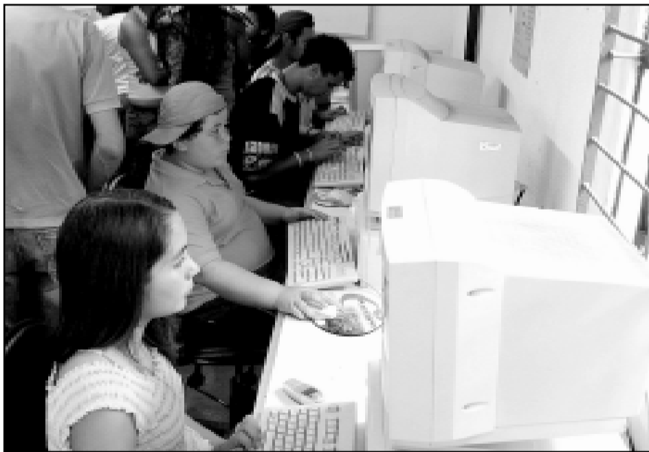
Programas de fomento à manutenção dos Telecentros serão discutidos no evento

Um dos destaques da pré-conferência, realizada nos dias 04 e 05 de maio, foi o incentivo ao empreendedorismo nos programas de inclusão digital, juntamente com a promoção