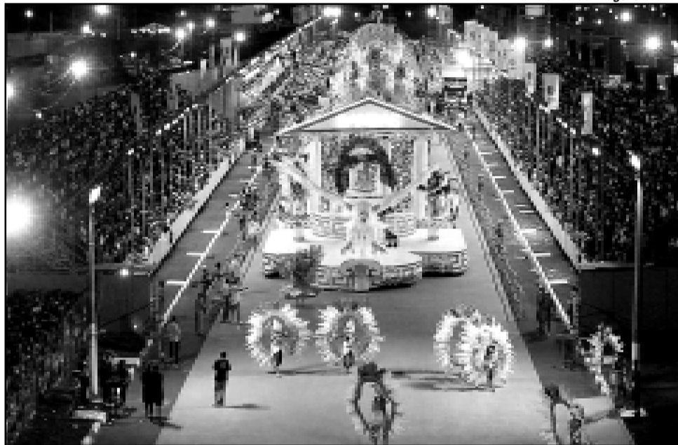
A partir de 2007, desfilam apenas dois grupos (Acesso e Especial)