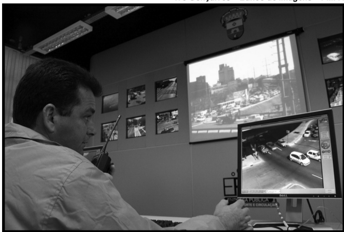
As imagens são transmitidas em tempo real para central onde técnicos monitoram e realizam ajustes na circulação

Azenha x Oscar Pereira Borges de Medeiros x Ipiranga Ipiranga x Salvador França Ipiranga x Silva Só Oswaldo Aranha x Paulo Gama Independência x Ramiro Barcellos Farrapos x Conceição Júlio de Castilhos x Conceição Mauá x Conceição Oswaldo Aranha x Protásio Alves Carlos Gomes x Plínio Brasil Milano