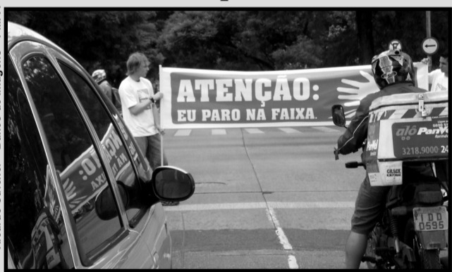
A campanha do novo sinal teve início em 9 de setembro

A Empresa Pública de Transporte e Circulação (EPTC) mantém sua agendas de ações educativas nas entradas e saídas das escolas em diferentes regiões da cidade, tendo como foco das iniciativas a campanha do novo sinal de trânsito. O objetivo é conscientizar o público infantil e jovem sobre os riscos, normas e leis de trânsito.