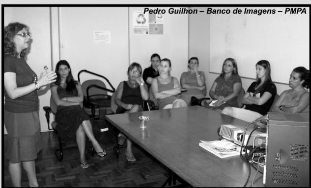
O telefone 156 é o primeiro contato da população no caso de suspeita de foco da doença

Telefone 156 — O serviço de atendimento funciona de segunda a sexta, das 7h às 19h, e recebe em média 2,5 mil ligações por dia. Segundo o coordenador do serviço, Antonio Sciortino, houve um aumento significativo no número nas últimas semanas, grande parte delas relacionadas a suspeita de focos de dengue.