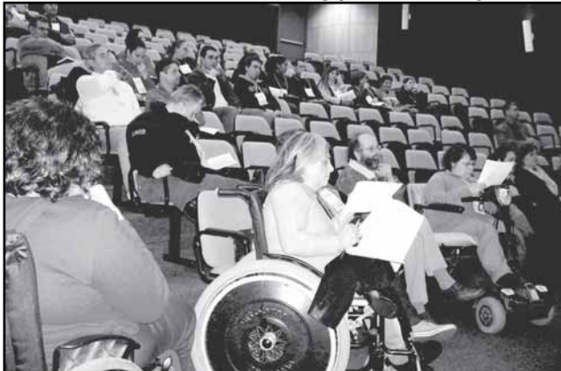
Primeira audiência de avaliação do plano ocorreu no fim de junho