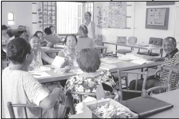
O curso se estende até 12 de agosto e o acompanhamento e a formação continuada ocorrem durante dez meses

Proaja — Tem como objetivo capacitar educadores e alfabetizar cidadãos que não tiveram oportunidade ou foram excluídos da escola antes de aprender a ler e escrever. Os alfabetizadores são professores e educadores populares que atendem a comunidade em geral e também populações indígenas, rurais, pescadores artesanais, pessoas com necessidades especiais, carcerários e jovens em cumprimento de medidas sócio-educativas.