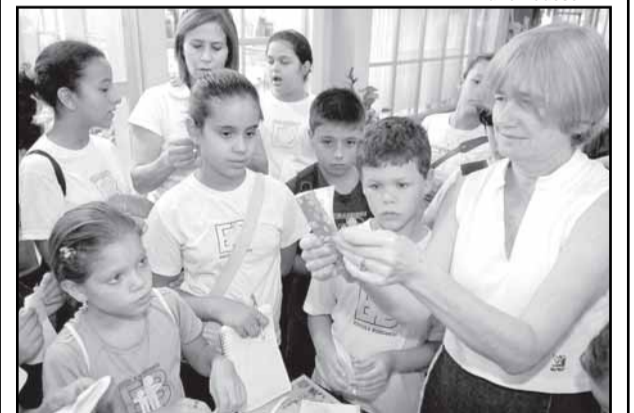
237 anos: alunos da Borghesi participaram de oficina de dobradura