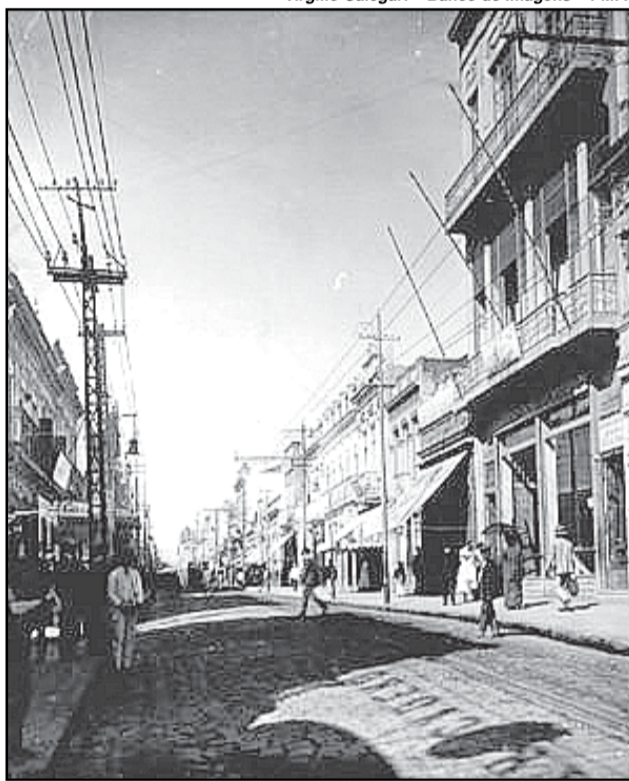
Rua da Praia: década de 10 do século 20

Em 1808, o Príncipe D. João elevou-a à categoria de Vila.