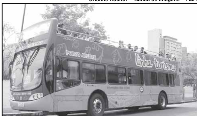
O ônibus Linha Turismo tem seu terminal e venda das passagens na Travessa do Carmo, 84- Bairro Cidade Baixa