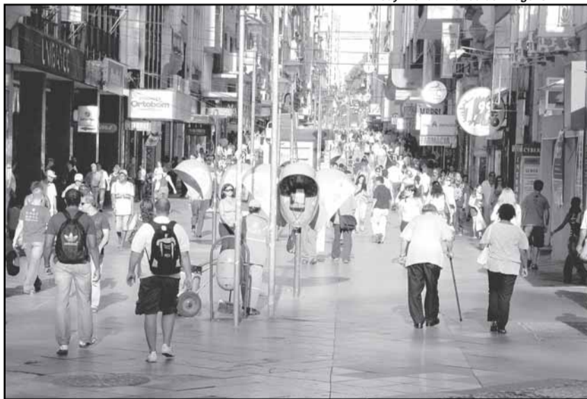
Rua da Praia: década de 10 do século 21