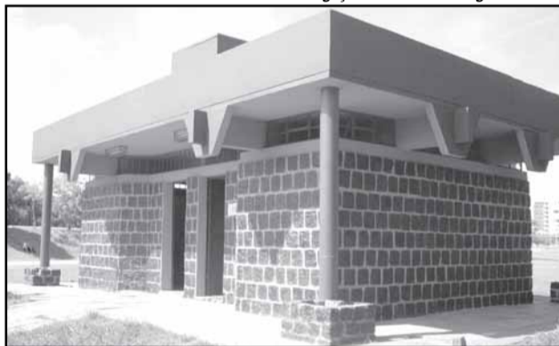
Reforma dos sanitários é parte do programa de revitalização da orla