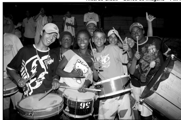
Esporte Dá Samba deve levar três mil crianças à avenida no sábado