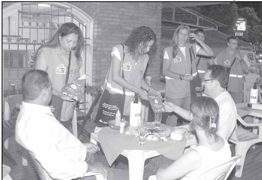
Ações educativas da EPTC contribuem para a redução dos acidentes