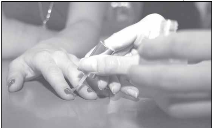
Curso é aberto a cabeleireiros, manicures, pedicures, barbeiros e esteticistas