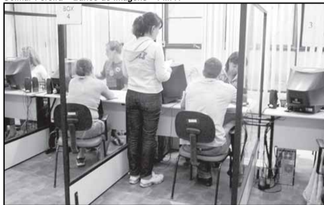
Com a documentação em dia, o alvará é emitido instantaneamente