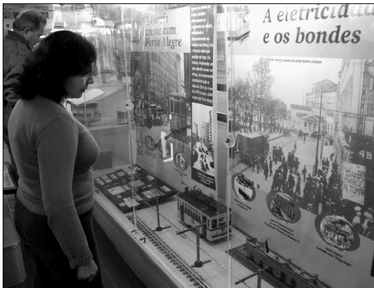
No interior do ônibus é possível conhecer o acervo de peças e documentos da mais antiga empresa de transportes urbano em atividade

Diretores e professores de escolas da Capital que quiserem agendar uma visita do Museu Itinerante da Carris, que é sempre acompanhada por uma monitora de História, podem ligar para 3289-2143 ou enviar fax para a Assessoria de Comunicação e Marketing da empresa, no telefone 3289-2102 ou e-mail para asscom@carris.com.br .