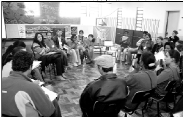
Os debates foram divididos em dois eixos onde foram avaliados avanços, dificuldades e os desafios da Assistência Social