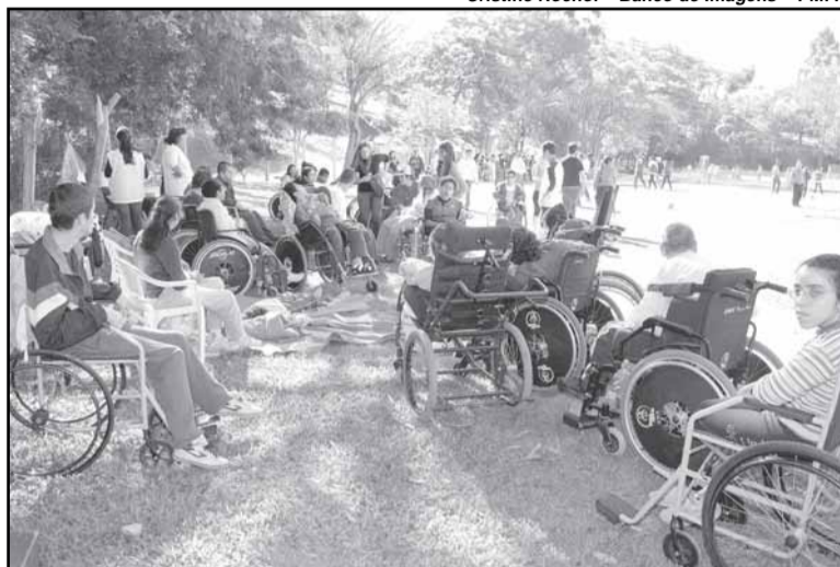
8º Festival Esportivo e Recreativo para Pessoas com Deficiência será no Parque Alim Pedro