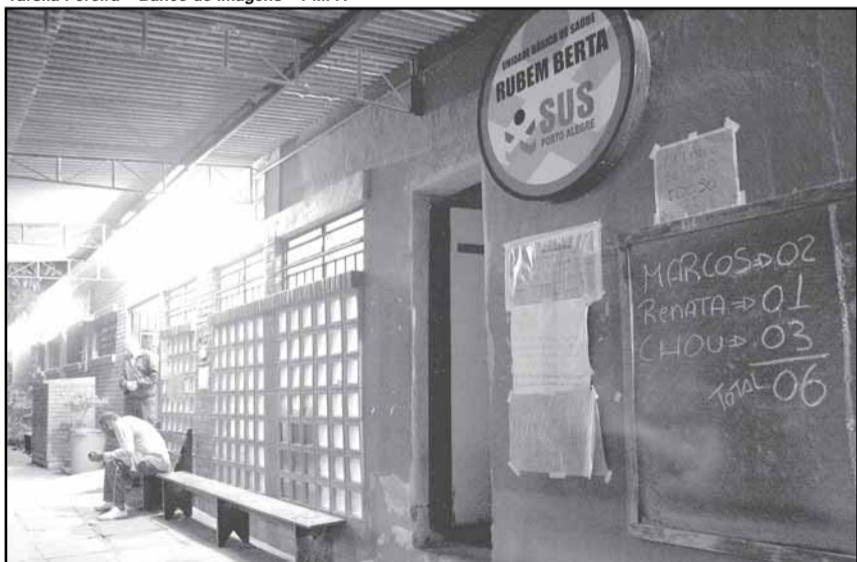
28 postos de saúde atendem pacientes em terceiro turno