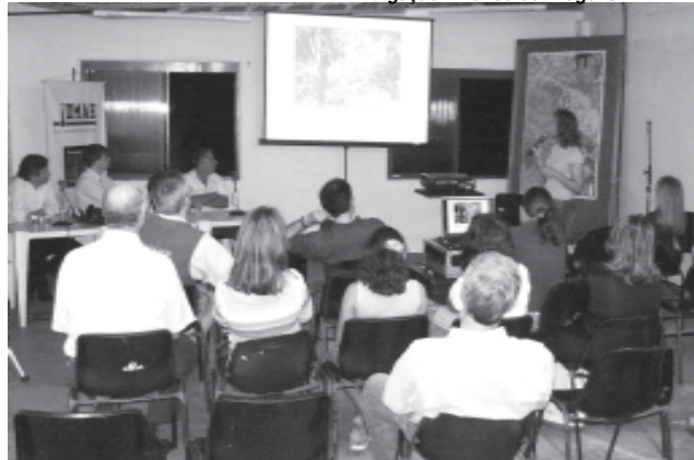
A audiência foi para conhecer os impactos ambientais específicos das obras

O Relatório de Impacto Ambiental (RIA) da Adutora de Interligação Belém Novo – Lomba do Sabão foi apresentado na última quinta-feira, 31, durante consulta pública realizada no CAR Avançado Lomba do Pinheiro (Estrada João de Oliveira Remião, 5450). Segundo o RIA, a adutora de 6750 metros de extensão que o Dmae planeja lançar na Lomba do Pinheiro é um empreendimento que não apresenta impactos ambientais específicos.