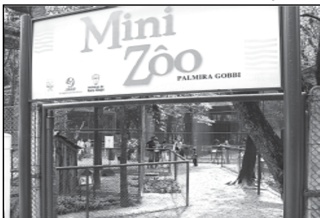
As escolas podem agendar visitas orientadas ao Minizôo