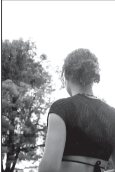
A adolescente F. P., 15 anos, faz curso de cabeleireira e planos para o futuro