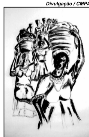
Dora explora dualidade

A exposição poderá ser visitada até 27 de outubro, de segundas a quintas-feiras, das 8h30min às 18 horas, e às sextas-feiras, das 8h30min às 16h30min. Informações na Assessoria de Relações Institucionais da Câmara (Avenida Loureiro da Silva, 255), telefone (51) 3220-4392.