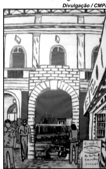
Divulgação / CMPA Desenho de Cristina Haberl

A exposição poderá ser visitada de segundas a quintas-feiras, das 8h30min às 18 horas, e às sextas-feiras, das 8h30min às 16h30min, no saguão do Salão Adel Carvalho da Câmara (Avenida Loureiro da Silva, 255). Informações pelo telefone (51) 3220-4392.