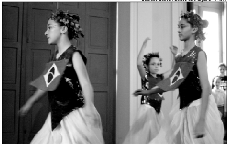
Grupo Semear do Centro Assistencial Sarandi se apresentou no lançamento