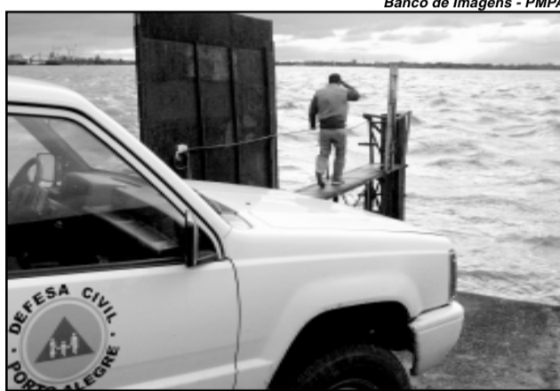
Serão construídos 150 Km de rede do tipo separador absoluto na Bacia do Arroio Cavalhada

Atualmente, são 33 mil viagens diárias de ônibus à área central, com ocupação média de 33% no destino final. Também são previstas obras físicas no Centro e uso de combustíveis lim-