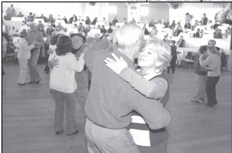
Baile da Primavera integra as atividades do mês do Idoso que se encerra em 21 de outubro