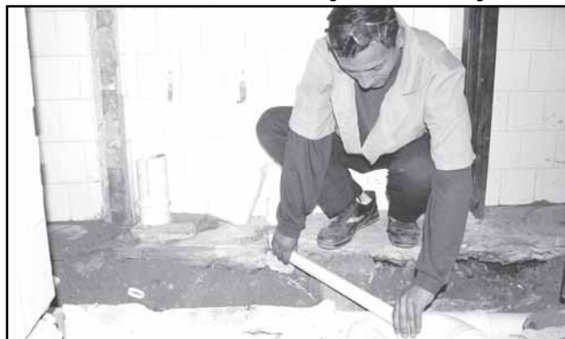
Curso ofereceu qualificação profissional em jardinagem, pintura predial, elétrica e hidráulica

Localizado em uma área de 21 hectares na Avenida Bernardino Silveira Amorim, próxima ao Complexo do Porto Seco, o loteamento terá, além das unidades habitacionais, 103 comerciais, escola e creches municipais, posto de saúde, galpão de reciclagem e centro comunitário, facilitando o acesso dos moradores aos principais serviços na área do condomínio.