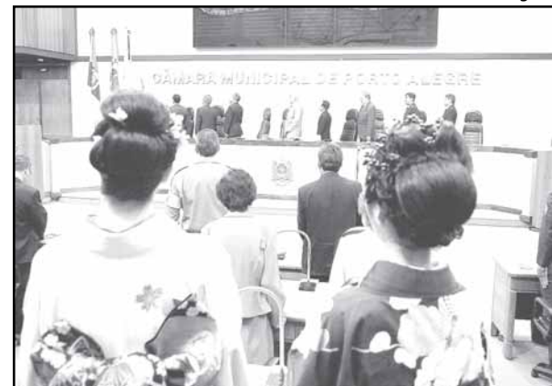
Comunidade japonesa prestigiou solenidade

Textos elaborados e de responsabilidade da Assessoria de Comunicação da Câmara