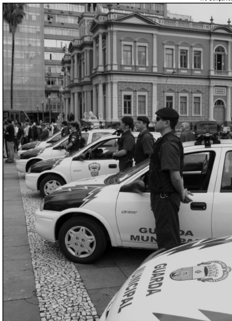
Novas viaturas para qualificar o desempenho da Guarda e aproximá-la da comunidade

Criada em 4 de novembro de 1892 com a denominação de Serviço de Vigilância Municipal, para garantir a segurança do patrimônio público, a Guarda sempre foi vista como uma equipe de zeladores dos bens móveis e imóveis do Município. Com a atual administração, a Guarda Municipal ganha novas atribuições. Além das ações nas unidades de saúde, abrigos e escolas municipais, terá atuação direta com a comunidade, na garantia de serviços e da segurança da população, no programa Vizinhança Segura . O objetivo é uma nova dinâmica de qualificação da equipe, hoje com 587 integrantes, para fazer com que o guarda seja cada vez mais um agente a serviço da população, tanto no que se refere à segurança urbana como na prestação dos serviços da Prefeitura.