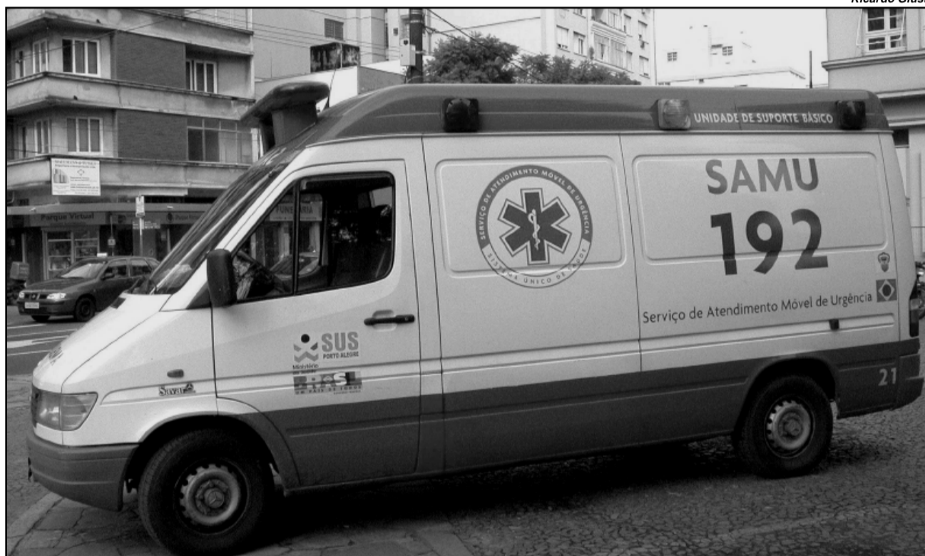
A frota operacional do Samu fica completa com onze unidades básicas e três ambulâncias de suporte avançado