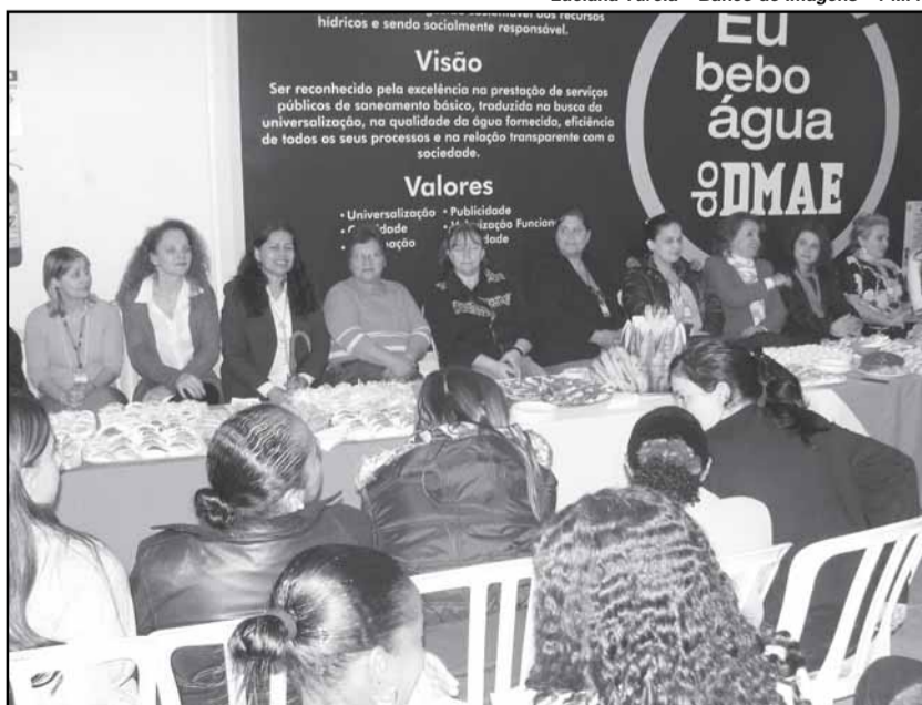
Atividades atendem a interesse das servidoras e prosseguem até o dia 15