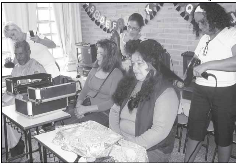
A tarefa da Humaitá chama-se “Movimento Solidário – vovôs e vovós, contem conosco”