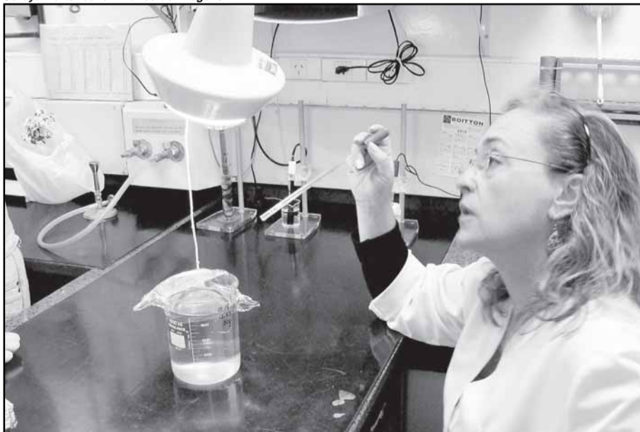
O trabalho em busca do reconhecimento iniciou em 2003, quando foi criado o Programa de Qualidade Total da Pesquisa