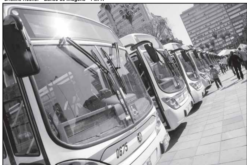
Desde que o segmento é pesquisado, a Carris sempre apareceu como a empresa de ônibus mais lembrada