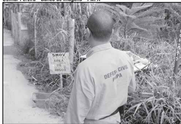
Até o momento, foram atendidas 128 ocorrências