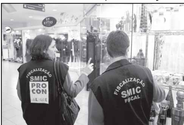
Três lojas foram notificadas por falta de alvará e Procon emitiu cinco autos de infração

A fiscalização contou com a presença do titular da Smic e do diretor do Procon que distribuíram aos comerciantes o Manual do Lojista, e ao público em geral o Manual do Con-